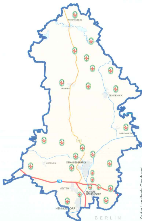
Karte: Landkreis Oberhavel

Ihr Geld ist bei uns gut angelegt und steuerlich absetzbar.